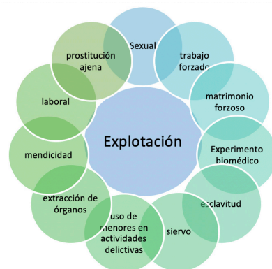
Figura 3. Conductas delictivas de explotación de víctimas